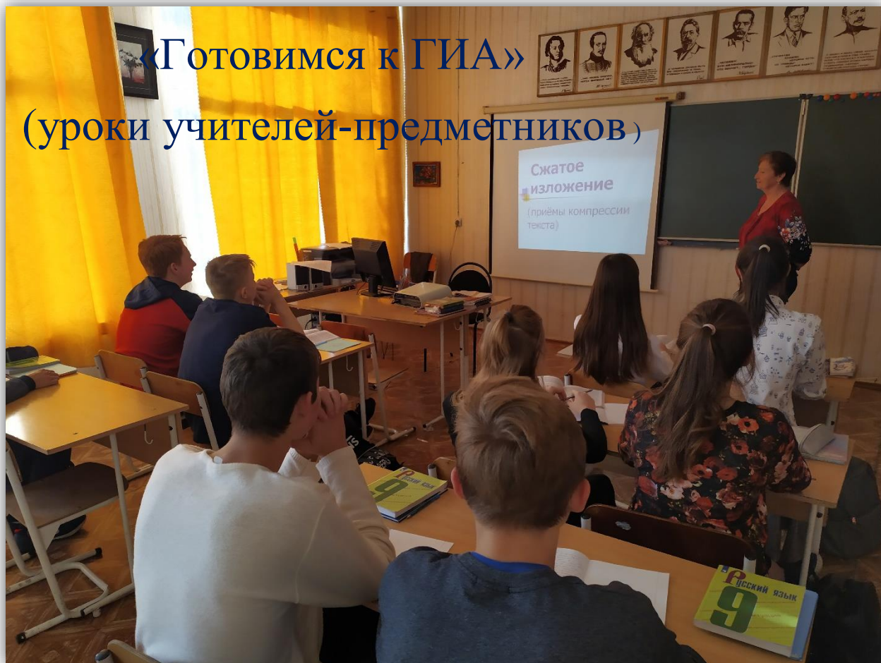
«Готовимся к ГИА» (уроки учителей-предметников)