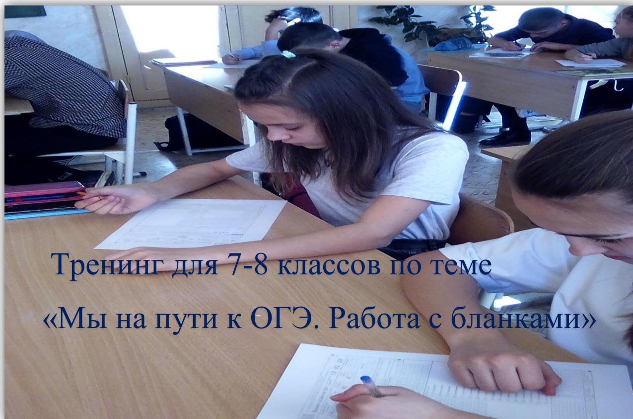
Тренинг для 7-8 классов по теме «Мы на пути к ОГЭ. Работа с бланками»